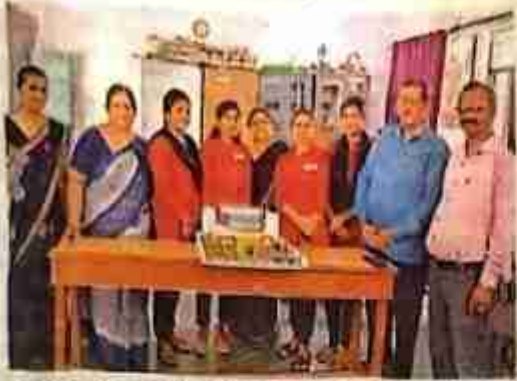
मतदाता जागरूकता पर राधाबाई कालेज में कार्यशाला।

मतदाता जागरूकता पर राधाबाई कालेज में कार्यशाला